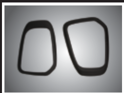
PROTECTORES DE ESPEJO