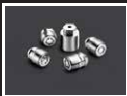
BIRLOS DE SEGURIDAD