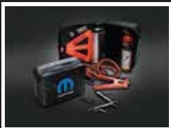
KIT DE EMERGENCIA