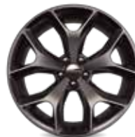
DUAL STRIPES DE ALUMINIO SATÍN CARBÓN DE 20"