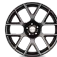
SCAT PACK DE ALUMINIO FORJADO DE 20"