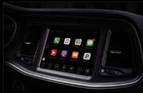
SISTEMA UCONNECT® 8.4" CON APPLE CARPLAY® Y GOOGLE ANDROID AUTO®