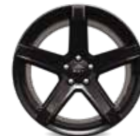
SRT® HELLCAT DE ALUMINIO FORJADO LOW GLOSS BLACK DE 20"