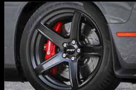
FRENOS BREMBO® DE ALTO RENDIMIENTO CON CALIPERS DE 6 PISTONES EN COLOR ROJO