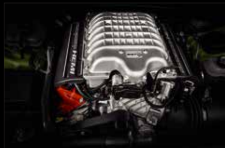
MOTOR HEMI® HELLCAT 6.2L V8 SUPERCARGADO CON 707 C.F. (VERSIÓN HELLCAT)